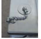
注水が簡単な給水口が付きました。